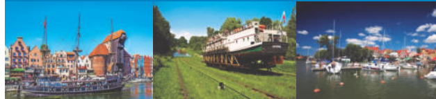
Danzig Schifffahrten: Oberländer Kanal + Spirdingsee (Mikolajki)

Der Norden Polens und Masuren sind abwechslungsreich und interessant: herrliche Landschaften und prächtig restaurierte Städte sind Ihre Reisebegleiter. Entdecken Sie das tausendjährige Danzig, die attraktive Hansestadt, folgen Sie den Spuren des Deutschen Ordens in Marienburg und genießen Sie die landschaftliche Schönheit von Masuren!