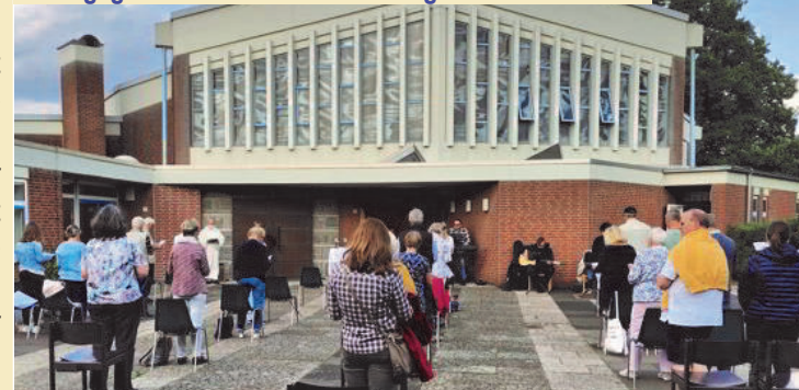
Freitagsgottesdienst vor St. Maria Regina am 03.07.2020