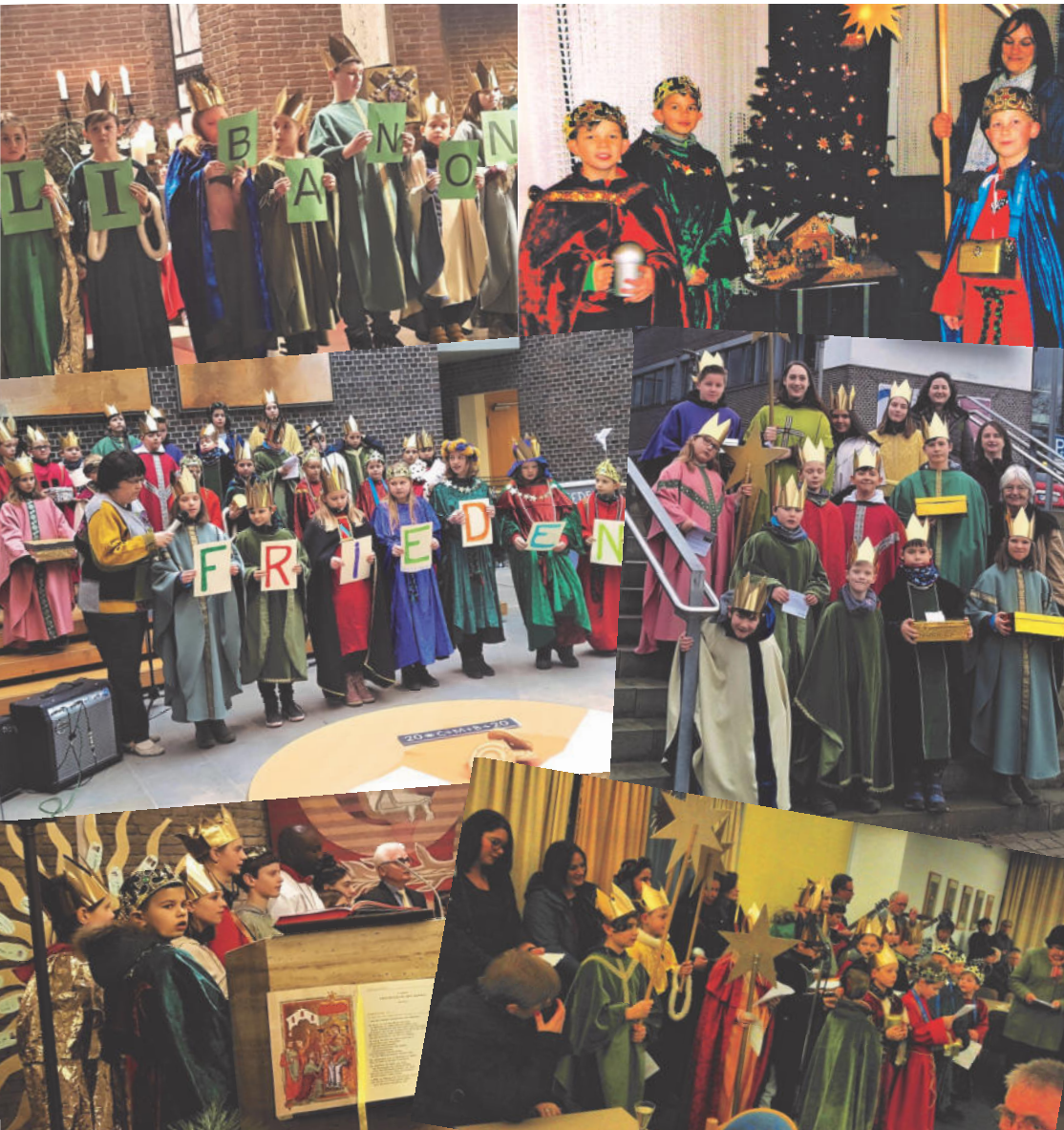
Sternsinger unterwegs in Garbsen