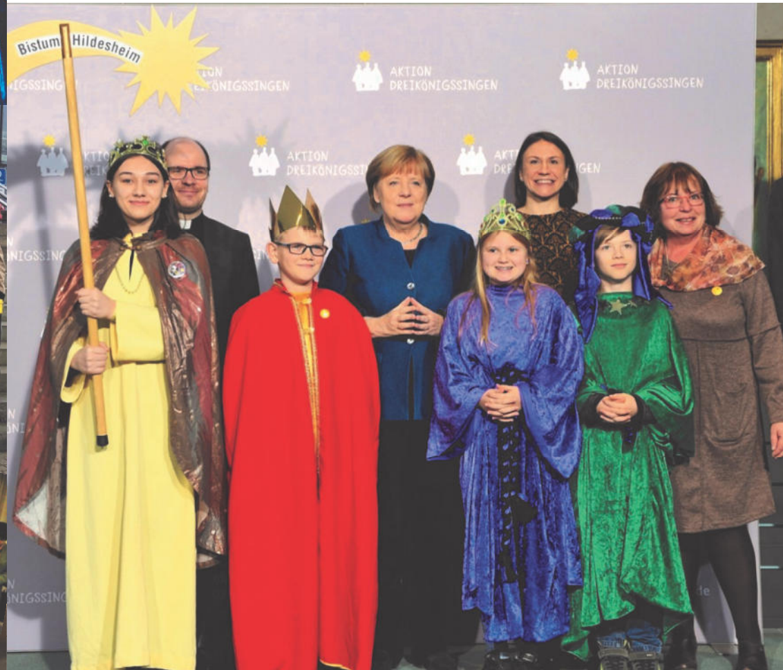
Garbsens Sternsinger im Bundeskanzleramt