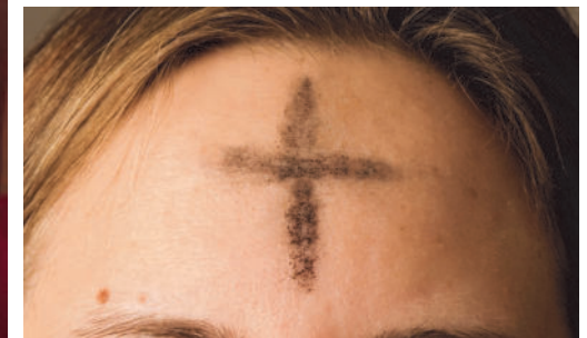
Aschenkreuz am Aschermittwoch

Monat Februar: Gottes Segen Lebensfreude in sich gehen